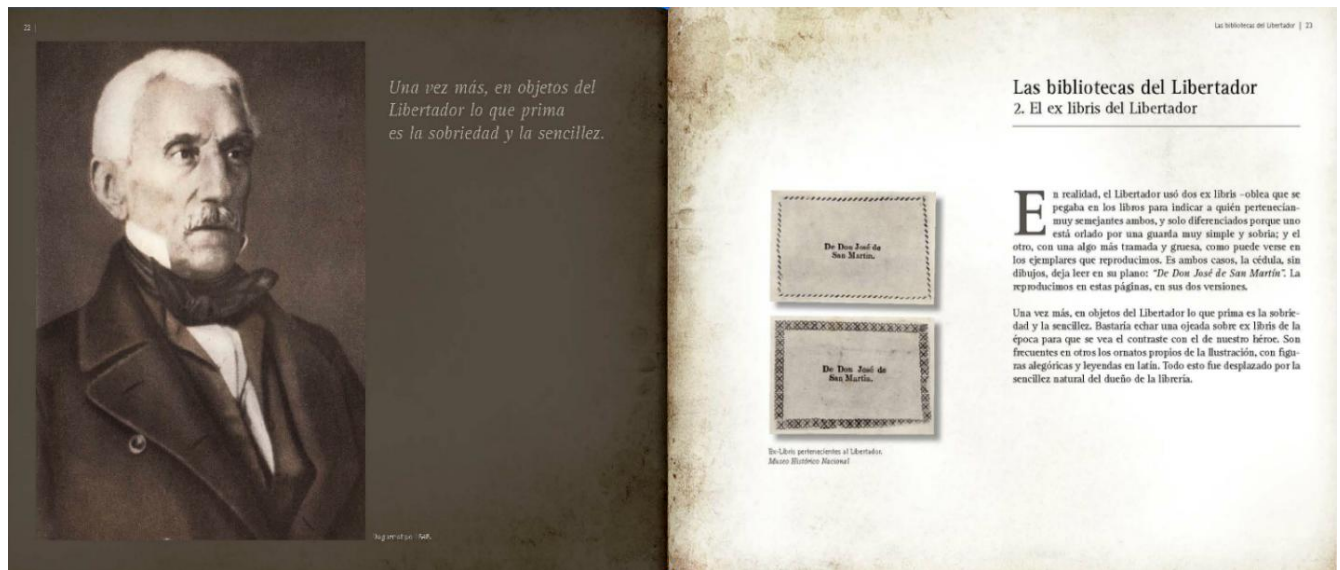
Ex libris del Libertador. Una de las imágenes internas del libro.

A partir del escueto listado que su mano trazó de los libros de su pertenencia, abocetadamente y sin orden, se ha compuesto un catálogo de su biblioteca, y, desde él se han rastreado y reproducido más de un cuarto de millar de las portadas de los libros que fueron suyos y que el cursó en sus travesías de lector. Esas reproducciones ilustran las páginas del presente volumen. La obra es un capital aporte para esclarecer la cultura del Libertador.”