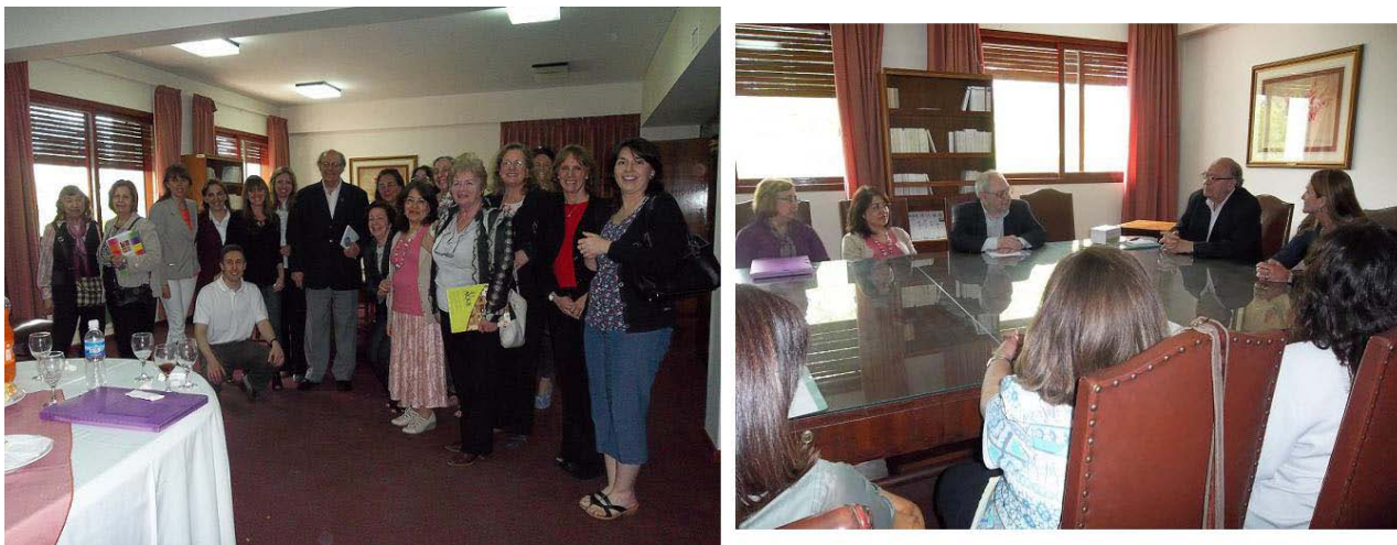
(El Presidente en la Facultad de Filosofía y Letras de la UNCu)