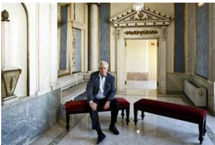
(Mario Vargas Llosa, en el Teatro Español.)