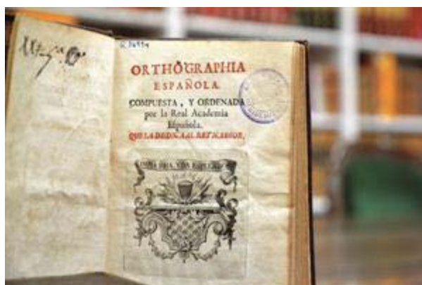
[El primer libro de ortografía de la RAE, Orthographia española, fue publicado en 1741 y es parte de la biblioteca de la institución. ]