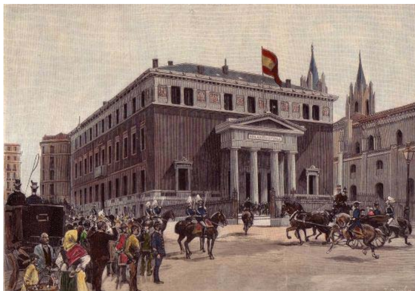
[Dibujo de Juan Comba publicado en La ilustración Española y Americana sobre la inauguración de la actual sede de la RAE el 1 de abril de 1894.]

Los actos oficiales del III Centenario de la RAE comenzarán el próximo 26 de septiembre, con la inauguración de la exposición La lengua y la palabra. Trescientos años de la Real Academia Española , en la Biblioteca Nacional de España. Los festejos concluirán con una nueva edición –la vigesimotercera– del Diccionario de la lengua española , que se espera sea publicada en el otoño de 2014, y con la celebración de un simposio internacional sobre “El futuro de los diccionarios en la era digital”.